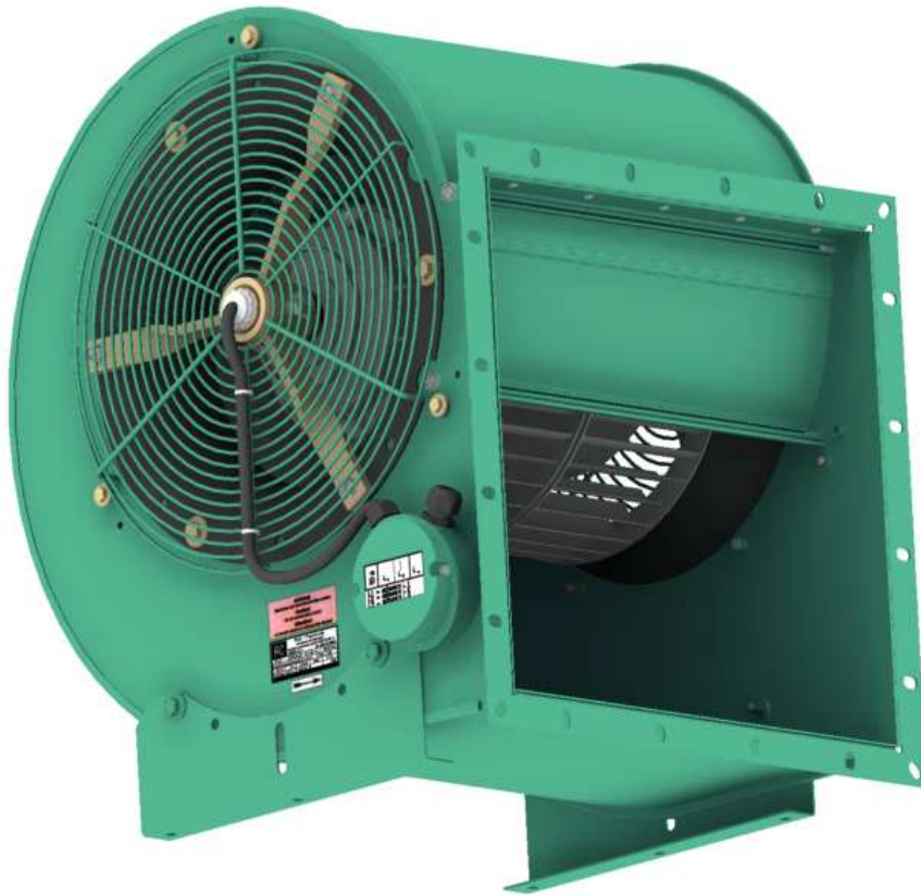
RC-T DRAD 315-4 575 V